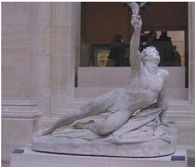
Filípides enfonsant-se després d'anunciar la victòria grega

Els grecs es van acostar als perses, els quals van respondre amb una pluja de fletxes, eludint els grecs aquestes al precipitar-se contra l'enemic, aconseguint així forçar la disposició en tancades formacions dels perses, que impedièn l'ús de la cavalleria.