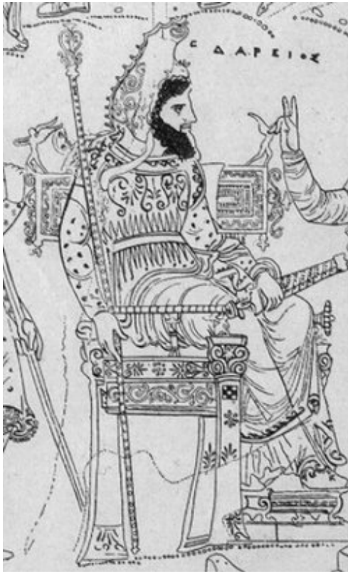
Darios I, rei dels perses]

les seues mans la situació, fent front així a la invasió persa.